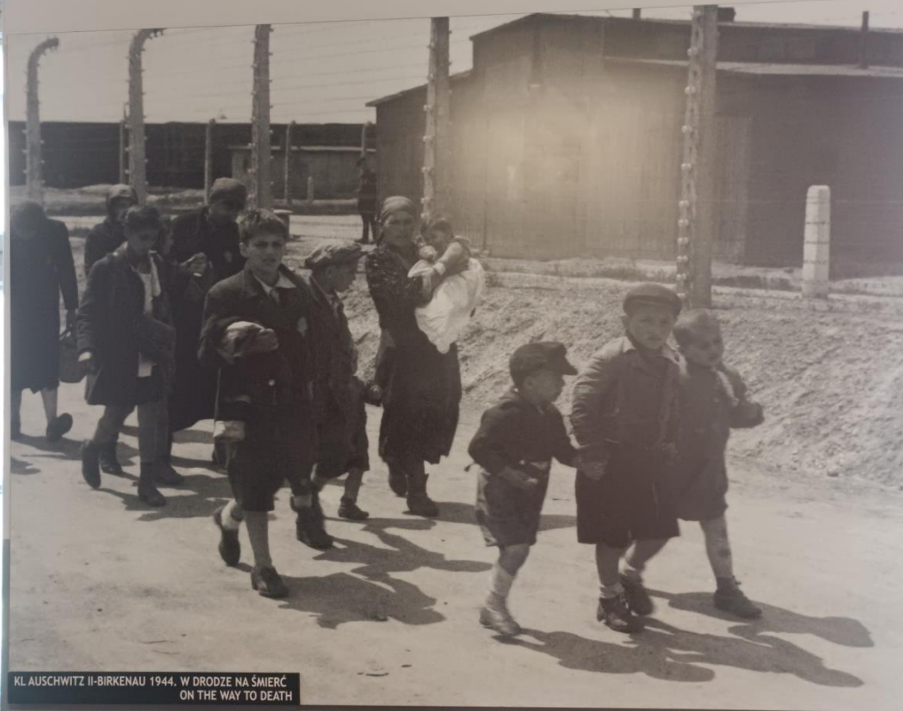
KL AUSCHWITZ II-BIRKENAU 1944. W DRODZE NA ŚMIERĆ ON THE WAY TO DEATH