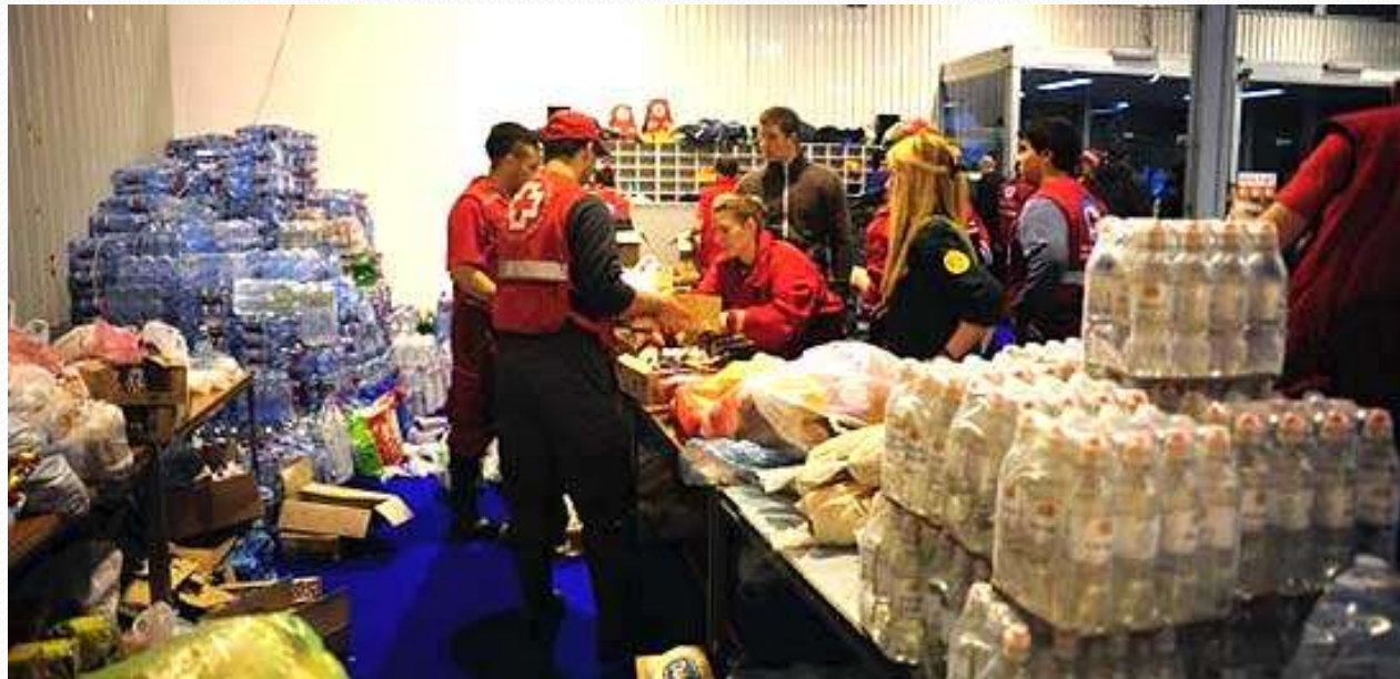
Prikupljanje pomoći u vreme poplava u Srbiji