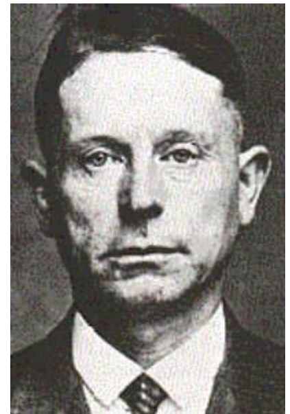
Peter Kurten, „vampir iz Dizeldorfa“