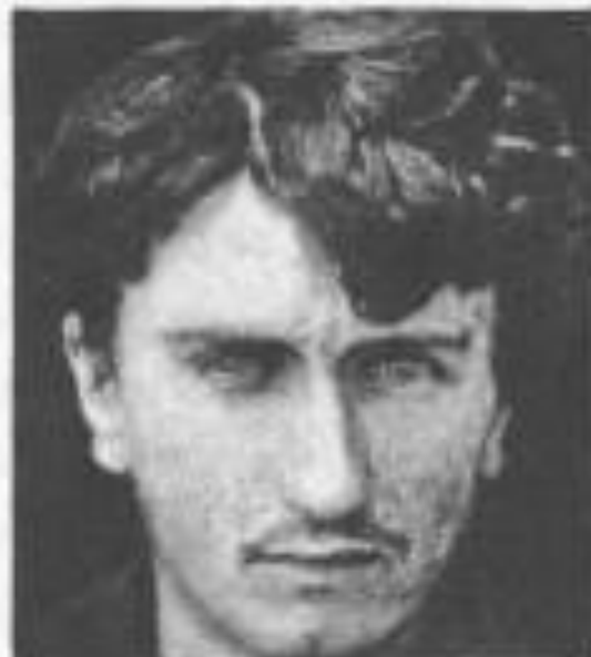
Fig. 22. Tipo comune di razza inferiore - Laetia mediocre .