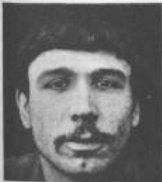
Fig. 21. Tipo di razza inferiore - Laetia abituale e forte .