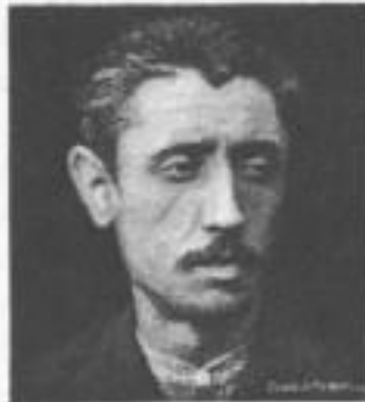
Fig. 24. Tipo comune di razza (degenerativa) - Brachiole .