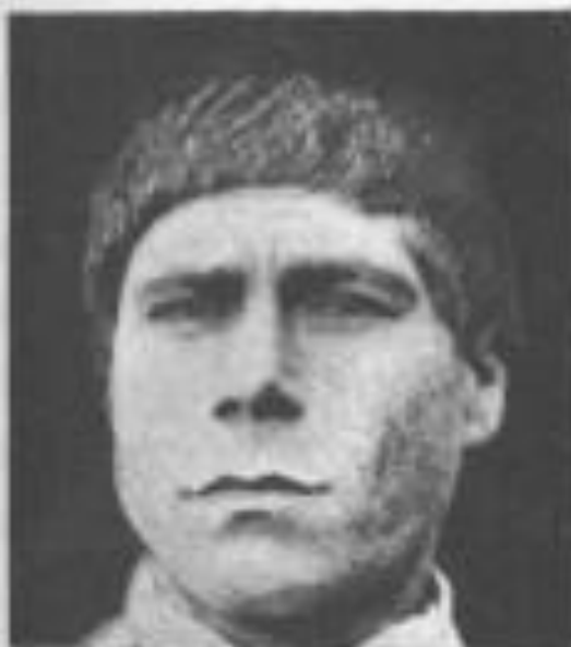
Fig. 20. Tipo di razza inferiore - Laetia mediocre .