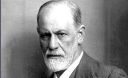
Sigmund Freud (1856-1939)